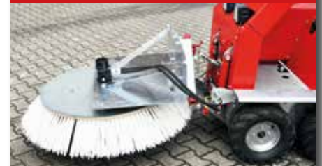
Radialbesen R 1200

R 1200 Ein sauberes Kehrergebnis garantiert der Dozer zusammen mit dem in Frontanbau montierten Radialbesen R 1200. Die PPN-Borsten fegen dank ihres Winkels jede Ecke sauber aus.