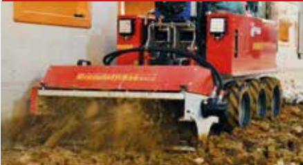
Granulatfräse GF 1000/15

GF 1000/15 Die Granulatfräse für den Heckanbau lockert in Geflügelställen festgetretenes Bodenmaterial wieder auf. Da der Boden durchtrocknen kann und die Tiere wieder scharren können, wird das Auftreten von Fußballenerkrankungen merklich vermindert.