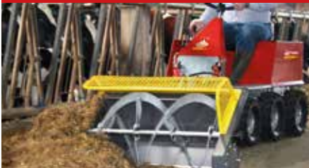
Futteraufbereiter FA 1200

FA 1200 Der Futteraufbereiter lockert und wertet das Futter durch offene Windungen ideal auf, ein sauberer Futtertisch ist durch eine flexible Gummileiste gewährleistet - dadurch verringern sich Schimmelrückstände oder Schmierschichten. Das Futter wird gleichmäßig und locker zurück in den Futtertrog befördert.