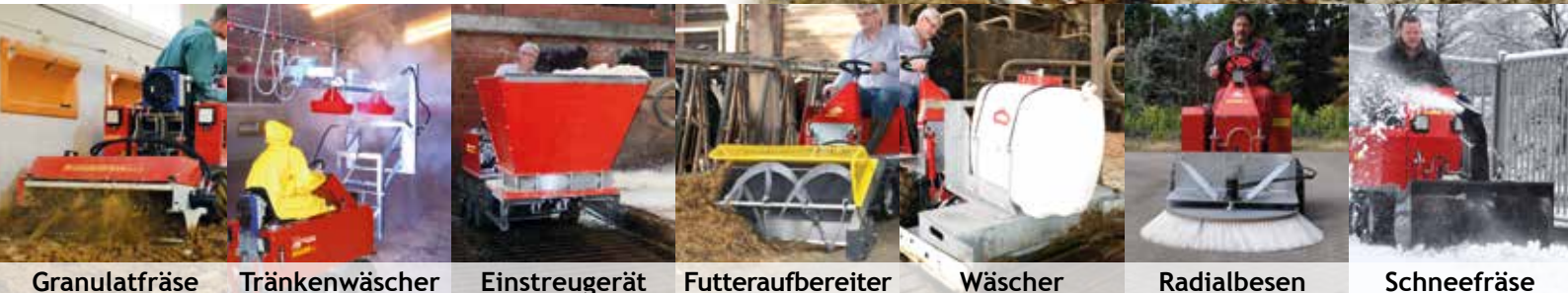
Granulatfräse Tränkenwäscher Einstreugerät Futteraufbereiter Wäscher Radialbesen Schneefräse

Sie wünschen eine Vorführung? Setzen Sie sich mit uns in Verbindung! Tel.: +49 (0) 59 31 / 4 96 90-0